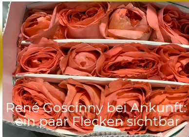
René Goscinny bei Ankunft: ein paar Flecken sichtbar

Schneiden Sie mit einem scharfen Messer etwa 3 cm von der Unterkante jedes Stieles ab und stellen Sie sie sofort ins Wasser. Entfernen Sie alle Blätter unterhalb der Wasserlinie. Wenn Sie die Blätter nicht entfernen, können sich Bakterien bilden und die Lebensdauer der Rose verkürzen. Füllen Sie die Behälter mindestens bis zur Hälfte mit Wasser. Die Rosen benötigen eine große Menge frisches Wasser mit Chrysal Blumennahrung , um wieder vollständig zu hydratisieren.