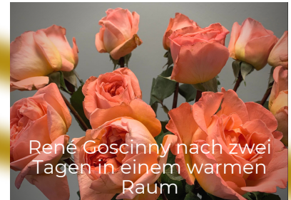
René Goscinny nach zwei Tagen in einem warmen Raum

Um Gartenrosen frisch zu halten, wechseln Sie das Wasser alle 24 bis 48 Stunden, oder sobald das Wasser trüb wird.