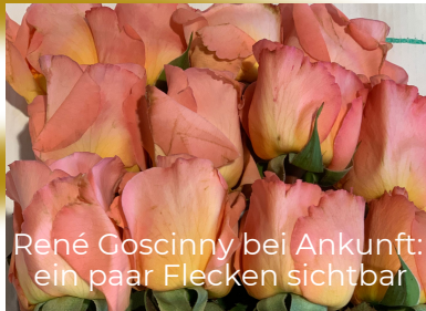
René Goscinny bei Ankunft: ein paar Flecken sichtbar